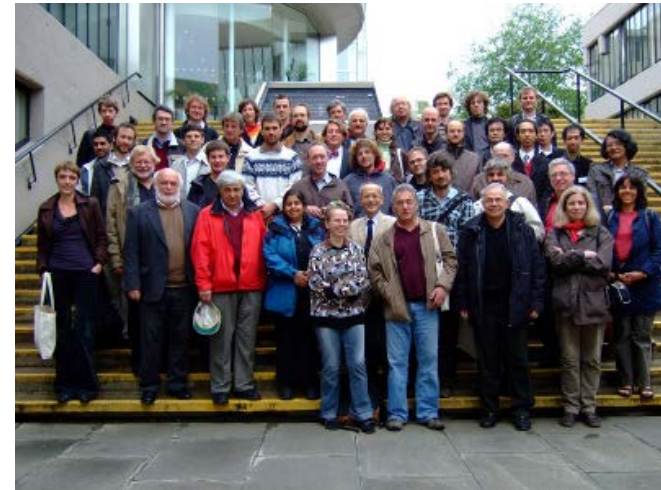
Algebraic Theory of Difference Equations と題して。Leedsにて。

上で図示した関数は第二 q パルヴェ方程式と呼ばれる差分方程式の解の一つです。このような一見複雑そうな関数が本当に複雑なのかどうか、有理関数や三角関数、指数関数などの比較的簡単な関数で表現できないだろうか、といったことを代数的な手法により研究しています。